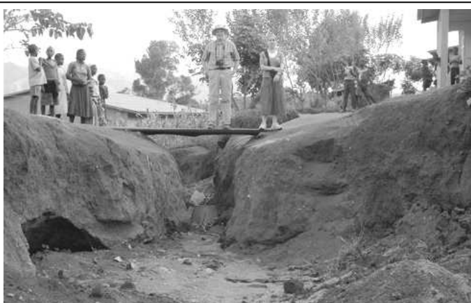
1. village d'Idjwi ravinement septembre 2009

En mai dernier cette situation s'est encore aggravée et le ravin traversant le village s'est approfondi et élargi (2).