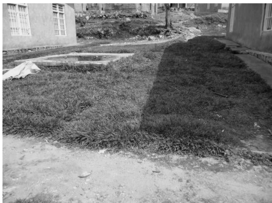
3. village d'Idjwi: l'herbe semée autour des maisons

En ce moment il y a la saison des pluies à Idjwi. Cependant les matins sont secs, ce qui permet aux travaux d'avancer, mais dès 4 heures de l'après-midi la pluie commence à tomber pour ne s'arrêter que le lendemain matin. Les travaux sont une course contre la montre car il faut limiter au maximum l'aggravation des dégâts causés par l'érosion en attendant que le canal d'écoulement puisse être mis en service.