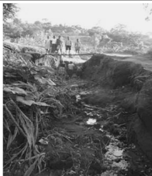
2. village d'Idjwi: le ravinement s'agrandit 11 mai 2010

Sur place, notre administrateur Désiré n'a pas attendu l'arrivée de l'aide extérieure.