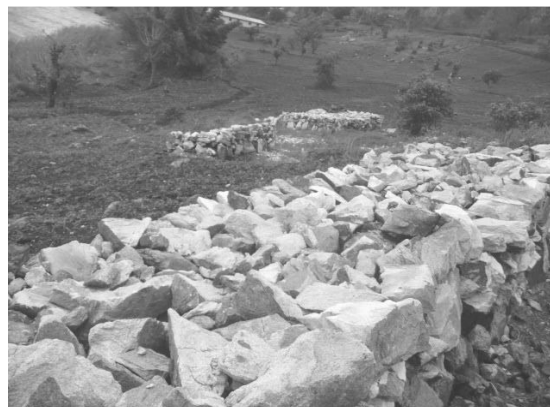
4. pierres apportées pour la construction canal